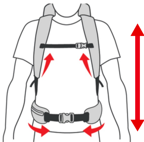
Rückenlänge von 42 - 50 cm.* = REGULAR

Für maximalen Komfort und den optimalen Verletzungsschutz ist die Größe deines Rucksacks von großer Bedeutung. Deshalb haben wir die ORTOVOX Rucksäcke in verschiedenen Größen für unterschiedliche Rückenlängen entwickelt. Die folgenden Informationen helfen dir, die perfekte Größe und -Form für deinen Rucksack auszuwählen.